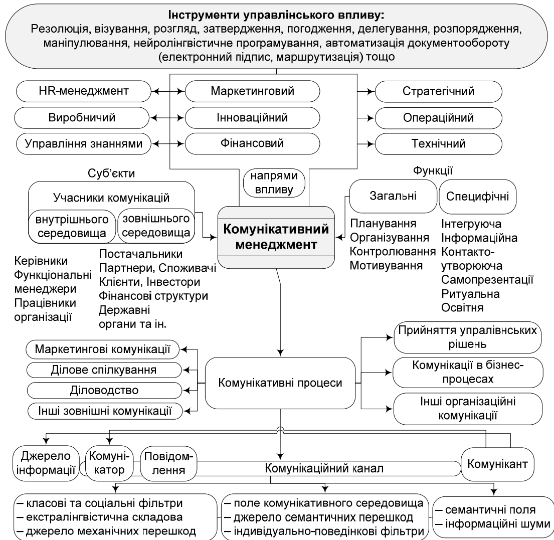
Рис. 2. Система комунікативного менеджменту організації*