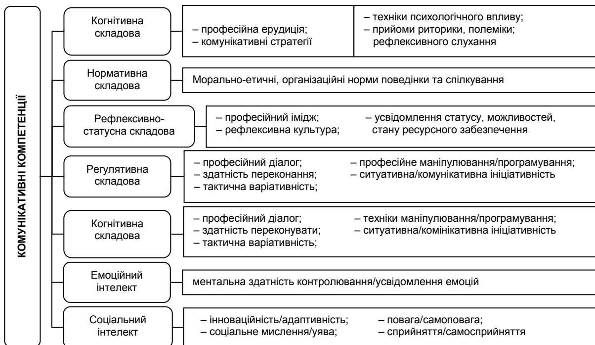
Рис. 4. Структура комунікативних компетенцій фахівця*

статньою умовою як результативності бізнес-процесів організації, так і ключовою конкурентною перевагою окремого індивіда в будь-якій професійній сфері на ринку праці. Шляхом наукового обґрунтування практичних потреб реалій сучасного бізнес-середовища можна виокремити компетентнісний базис висококваліфікованого фахівця в будь-якій сфері професійної діяльності: базові професійні компетенції (достатній професійний інструментарій у конкретній предметній області відповідно до сфери діяльності організації); спеціальні професійні компетенції у сфері інформаційних технологій і систем (IT&C); комунікаційні компетенції (у т.ч. компетенції ділового спілкування й міжособистісних взаємовідносин, лінгвістичних і соціальних компетенцій, компетенцій емоційного інтелекту тощо) [7]. Варто додати, що компетентнісний базис фахівця буде відрізнятися за складом, рівнем та структурою (рис. 4 [8; 9; 10; 11]) професійних вимог відповідно до статусу (технічний виконавець (для менеджерів – технічний рівень управління) – необхідний рівень професійних компетенцій; експерт (управлінський рівень) – достатній рівень; лідер (топ-менеджмент) – корпоративний (стратегічний) рівень) організаційної одиниці.